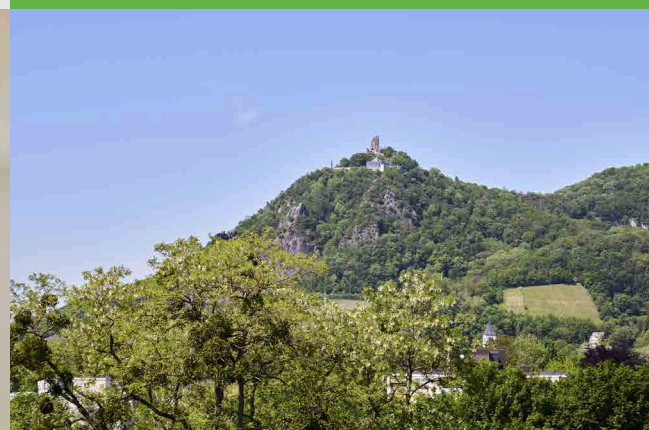
Ausblick aus unserem Haus auf den Drachenfels